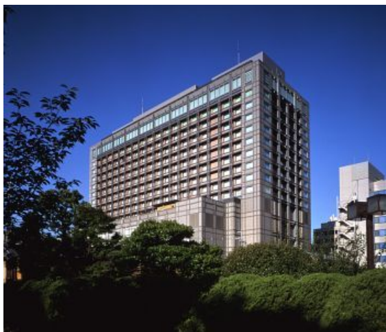
дворец, храм Тоji, замок Nijo. Single Room

Kawaramachi-Oike, Nakagyo-ku, Kyoto 604-8558 Japan