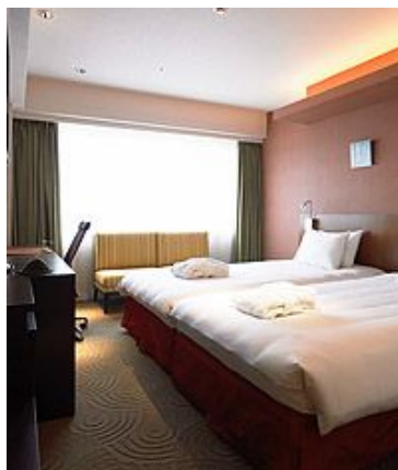
Executive Twin 17-22 м 2