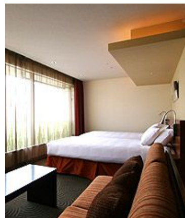
Kotoran Suite 38 м 2