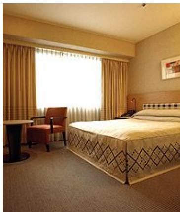
Superior Double 20.5 м 2